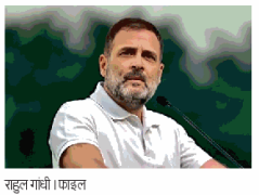
राहुल गांधी।