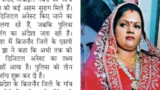
मौजा का फलक छोटी। सी रवजन

नई दिल्ली, 13 जून। बिजनौर में डिजिटल अरेस्ट से परेशान महिला ने फंदे से लटककर दी जान। पुलिस को लकड़वाले का अंधेरा, तीन टैग कर रही जांव