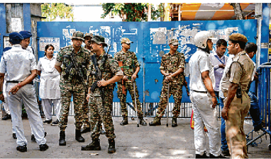
पोलकात के भवानीपुर रिहायशाला में भारतीय सुरक्षा स्थल स्थित स्ट्रांग रूम के पास गुप्तकार तासुई गणनाकर्मियों के बाद उभार को हरा देने सुनिश्चकर्मों में

आयोग ने जारी किया एस्काइएन नंबर 1800 345 0008 और ई-मेल wbfreenandfairpolls@gmail.com