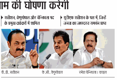
वी.डी. सतिशान, के.सी. वेणुगोपाल, रमेश चिन्मियाल। पहाल

नई दिल्ली: कई दिनों के सर्पेंस और लंबी चर्चाओं के बाद कांग्रेस ने घोषणा की है कि वह गुजरात को केरल में मुख्यमंत्री के नाम की घोषणा करेगी। गुजरात में कांग्रेस के अल्पसंख्यक सरकार के नाम की घोषणा करेगी। गुजरात में कांग्रेस के अल्पसंख्यक सरकार के नाम की घोषणा करेगी।