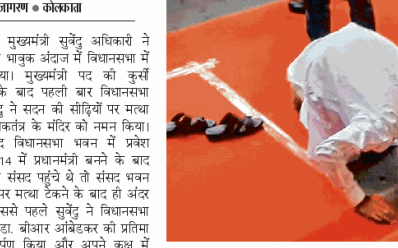
कोलकाता में कुवार को विधानसभा में प्रवेश करने से पूर्व सीढ़ीय पर मध्य टेकने बंगाल के मुख्यमंत्री सुवेंदु अशिकर।

संयम उपरकत रहेंगे। शकनीपुर में उन्होंने ममता को मुख्यमंत्री रहते 15 हजार से अधिक वोटों के अंतर से हराया। चुनाव जीतने के बाद सुवेंदु ने नंदीग्राम में लोगों को धनदात्र सभा में संकेत दे कर थे कि वह यह सूर्ये छोड़ने केबिनेट निरम के अनुसार वह किसी एक जगह से ही विधायक रह सकते हैं। उन्होंने भरसा दिलिया कि नंदीग्राम के लोगों को कभी यह महसूस नहीं होने दिया जायगी कि वह उनके साथ हैं।