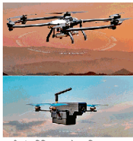
यूएवी लॉन्ग रेंज वाता देश का पहला स्वदेशी लोडरिंग गाइडेड यूनिशन (ऊपर) और कामीकाजी ड्रोन (नीचे) का वीडियो।

यूएवीपीजीएम ड्रोन से लॉन्ग रेंज वाता देश का पहला स्वदेशी लोडरिंग गाइडेड यूनिशन स्थिर व तालमगाम जीपीएस और डेटा लिंक के साथ कम्प्यूटेशनल जाम भेजने पर भी प्रभावी एंटी-जैमिंग और एंटी-रफ्लिग तकनीक से लस रिसरक यूएवीपीजीएम 200 किलोमीटर दूर तक लक्ष्य भेजने पर सक्षम दो किलो वारहेड के साथ लक्ष्य के एक मीटर दायरे तक हमले की क्षमता