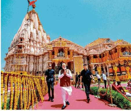
सोमनाथ मंदिर का नया स्वरूप।

11 तीर्थों के जल से मंदिर के सिद्धर कला का 90 मीटर ऊंची ट्रेन के माध्यम से प्रधानमंत्री ने किया अर्पण