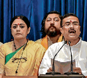
सुवेदु अधिकारी की अगुवाई वाली भाजपा सरकार ने कैबिनेट को पहली ही बैठक में कई बड़े फैसले लिए हैं।

सुवेदु अधिकारी की अगुवाई वाली भाजपा सरकार ने कैबिनेट को पहली ही बैठक में कई बड़े फैसले लिए हैं। सबसे बड़ा फैसला सीमा सुरक्षा को लेकर रहा। इसके तहत बीएसएफ को कंट्रोले बाड़ लगाने के लिए राय सरकार अगले 45 दिनों के भीतर जमीन हस्तांतरित कर देगी। इसकी अहमियत इसी से समझी जा सकती है कि बंगाल से लगती बांग्लादेश की सीमा पर 569 किमी तक बाड़ नहीं है। यह कई दशकों से लिखित था। कैबिनेट बैठक में जहां एक ओर रोजगार, सुरक्षा और केंद्र-राज्य समन्वय पर जोर दिया, वहीं दूसरी ओर पूर्ववर्ती सरकार की नीतियों से अलग रख भी साफ नजर आया।