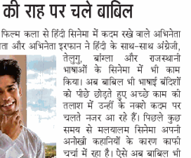
मलयालम सिनेमा में कदम रख रहे बाबिल। @babli.j.k (ट्विटर)