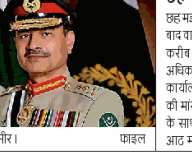
आसिम मुनीर। फाहल

नई दिल्ली, एफएड: पाकिस्तान के सेना प्रमुख फौजद माराल आसिम मुनीर का हाल में किया गया यह विचार कि आररोपेशन सिद्धर के दौरान संघर्ष विचार के दौरान भारत ने अमेरिका से संकथ किया था, अमेरिकी लांबिक रिक्सर्स से मेल नहीं खाया।