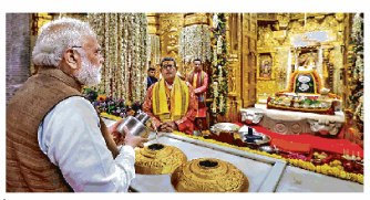
गुजरात के वेरावल में सोमनाथ की सोमनाथ मंदिर में पूजा-अर्चना करने प्रधामंत्री नरेंद्र मोदी।