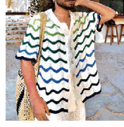
खतरा के डिकलरी 15 में बाँट प्रीत्यमों भाग ले रहे हैं ओरी।

असुर टोसर्स के निशाने पर रहने वाले इंटरनेट मॉडिया परसैनीटो ओरी (ओरुआन अवात्रामिण) टोलींग को गंभीरता से नहीं लेते हैं।