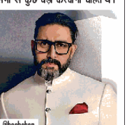
मनोरंजन से जुड़ी अन्य खबरों के लिए खोजें या @jagran.com

कम अक्षय को ये देखी निम्नी हो, तो कलाकार कई बार बिना फीस लिए ही काम कर लेते हैं। ऐसा ही कुछ फिल्म अभिनेत्री अश्विनी कव्ठन ने फिल्म राजा शिवाजी में किया।